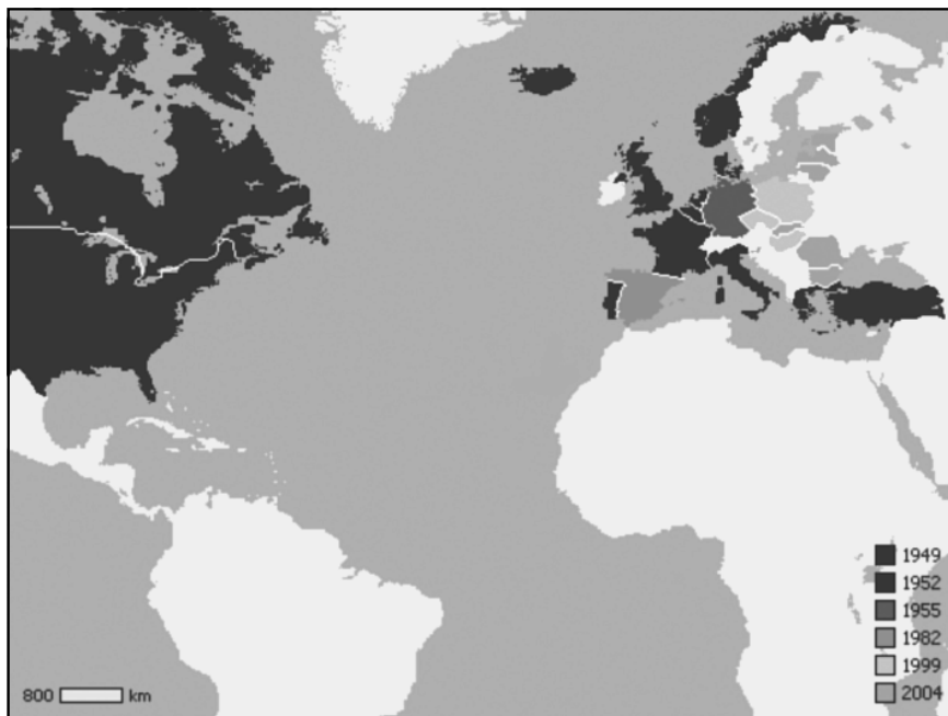
Figura 3 – A OTAN em 1949 e os seus sucessivos Alargamentos