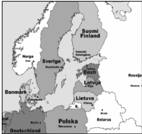
Figura 3: A Região Báltica

O clima gelado existente na parte mais setentrional faz com que a navegação seja suspensa durante o Inverno e princípio da Primavera, nomeadamente no Golfo de Bothnia (entre a Suécia e a Finlândia), no Golfo da Finlândia (banha a Finlândia, Rússia e Estónia) e, embora durante menos tempo, no Golfo de Riga (entre a Estónia e a Letónia).