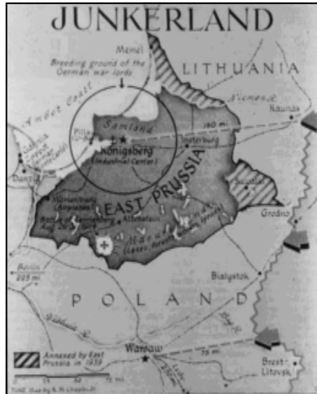
Figura 1: Prússia Oriental

Com efeito, em 13 de Janeiro de 1945, Königsberg é conquistada a ferro e fogo, sendo que Estaline haveria de considerar que a anexação desta pequena parcela de território alemão era a justa contrapartida pelas enormes perdas humanas 7 que a URSS experimentara ao longo da Segunda Guerra Mundial. Não devemos esquecer que Königsberg representava uma monumental vantagem para a URSS, que passava a dispôr de um porto no Mar Báltico, onde os gelos característicos destas regiões tão setentrionais não existem. As limitações