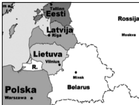
Figura 4: Kaliningrado

A Frota Russa do Báltico, graças aos mares livres de gelo, está aí baseada. Sendo uma frota com menor importância que outras da Federação, assume, no entanto, o papel de plataforma de operações militares na região Báltica e de “...posto de alerta avançado para prevenir ataques ocidentais” (Chillaud, 2003, 42). Paralelamente, funciona como garante da salvaguarda dos interesses económicos russos na região.