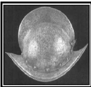
Fig. 8 - Arma Defensiva, Espaldar — Museu Militar de Elvas, "Sala de Armas" to Museu "Forte de Santa Lúzia".

Quanto ao armamento defensivo que foi utilizado destaca-se sobretudo: a Coura - peça utilizada para proteger a parte do tronco do homem, é feita de couro de vaca; o Morrião - armadura para a cabeça, de forma cónica, com crista e aba levantada nos dois extremos; Chapéus de ferro - Armadura em forma de capacete, utilizado para proteger a nuca; o Espaldar - parte da couraça que protege as costas; o Escarcela - constituídas por duas ou três peças de ferro articuladas que se fixavam na parte debaixo do peito para defesa das pernas (coxas).