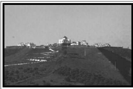
Fig. 5 - Forte da N.ª Da Graça

A Praça de Elvas, apesar do cerco de Badajoz, à muito que se preparava para esta Batalha, porque como afirma Paulo Duarte (2005), na entrevista