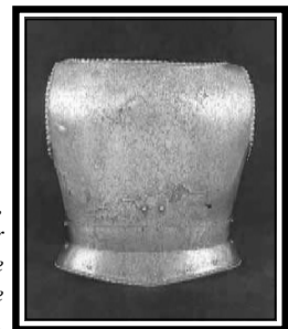
Fig. 9 - Arma Defensiva, Morrião — Museu Militar de Elvas, "Sala de Armas" to Museu "Forte de Santa Lúzia".