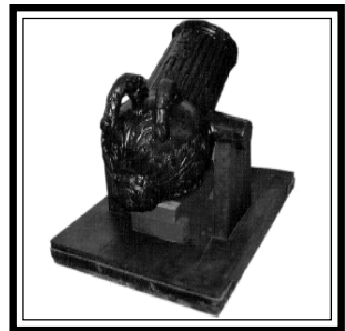
Fig. 6 - Peça Panela — Fotografia cedida pelo Museu Militar de Lisboa, "Sala da Restauração".

As armas ofensivas mais utilizadas foram as seguintes: o Arcabuz - arma de fogo curta e de cano largo, sendo o seu alcance útil 120 metros, mas para o seu fogo ter um efeito prático, geralmente só se fazia a 20 ou 30 metros do inimigo. A carga do arcabuz era incendiada por meio de uma mecha que se colocava na serpentina; o Polvarinho - recipiente para transporte da pólvora; o Mosquete - arma de fogo cujo comprimento oscilava entre 1, 25 e 1,44 metros, pesando