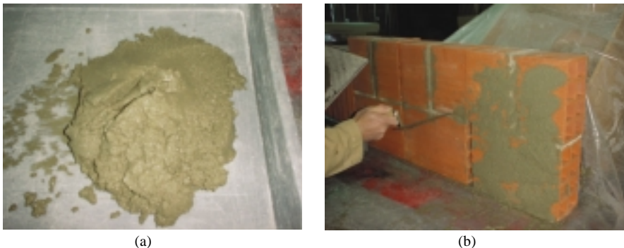
Figura 1 – (a) Argamassa para preparação de provetes a ensaiar; (b) Execução de um conjunto de provetes - 1ª camada do reboco (salpico).

Serão abordadas, embora apenas como estado da arte, outras soluções de revestimentos exteriores para fachadas de edifícios, com alguma aplicação em