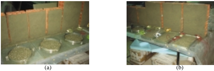
Figura 2 – (a) Preparação dos provetes para o ensaio da determinação do coeficiente de capilaridade; (b) Preparação dos provetes para o ensaio do humidímetro.

Relativamente à exigência funcional impermeabilização, serão utilizados os ensaios: determinação do coeficiente de capilaridade adoptado para sistemas de revestimento (EN 1015.18 [3] ) e o ensaio do humidímetro, também desenvolvido no LNEC [4] [5] (ficha de ensaio LNEC FE Pa 38 [6] - figura 2 ).