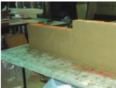
Figura 3 – Provetes para execução dos ensaios de aderência ao suporte e de análise da durabilidade.

Para o estudo e análise do comportamento dos rebocos correntes em relação à sua aderência ao suporte, serão adoptados painéis (também utilizados para o estudo da fissuração) e o ensaio do pull-out realizado segundo a norma EN 1015.12 [7] - figura 3 .