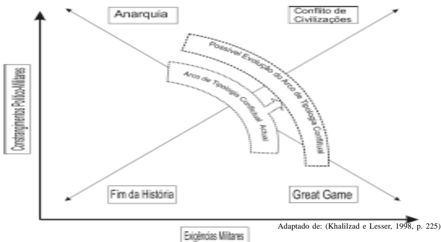
Figura 1 - Exigências e Limitações Face a Quatro Cenários Alternativos 65 e Possível Evolução do Arco de Tipologia Conflitual

No mesmo estudo foi delineado um gráfico que avançava implicações para as forças militares dos EUA consoante quatro cenários (o "fim da história", o "conflito entre civilizações", o de anarquia e o de Great Game 64 ). Neste contexto podemos colocar o referencial de exigência actual para os EUA e para as grandes potências - uma vez que de uma forma geral partilham interesses comuns na estabilidade do sistema internacional - de acordo com o arco de tipologia conflitual referido, na figura 1.