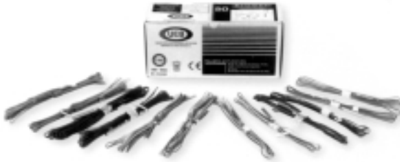
Figura 3 [6] - Detonadores eléctricos de diversas características.

Estes detonadores são constituídos por duas ou três partes, consoante se trate de detonadores instantâneos ou de atraso. As três partes referidas são: a eléctrica; a explosiva e, no caso dos detonadores de atraso, a substância retardadora (figura 3).