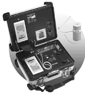
Figura 8 [3] - Consola de fogo e detonador Daveytronic.