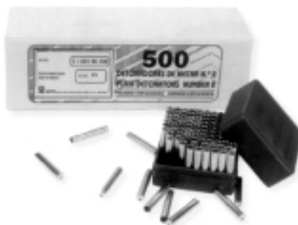
Figura 4 [5] - Detonador pirotécnico ou ordinário.

O detonador pirotécnico caracteriza-se por possuir um invólucro de alumínio, no interior do qual existe uma carga de explosivo composta por um explosivo secundário (base) e primário (na zona em contacto com o cordão lento) (figura 4).