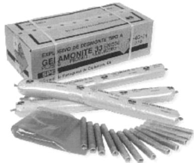
Figura 2 [6] - Explosivo Gelamonite 33. Actualmente, é o tipo de explosivo mais empregue nos trabalhos de demolição em Portugal.