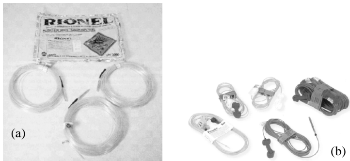
Figura 5 - Detonadores não eléctricos: (a) tipo Rionel [2] ; (b) tipo Primadet [6] .

O sistema de detonadores não eléctricos foi inventado por uma empresa Sueca, tendo sido designado por Nonel. É constituído por um tubo de plástico, conhecido por tubo de choque, com cerca de 3 mm de diâmetro, que contém no seu interior uma substância reactiva (por exemplo, os tubos dos detonadores Primadet - semelhantes ao Nonel - fabricados em Espanha, contém no seu interior PETN). Esta substância, quando iniciada por explosor adequado, cordão detonante ou por detonadores eléctricos, sustém a propagação de uma onda de choque a uma velocidade de aproximadamente 2000 m/s (figura 5).