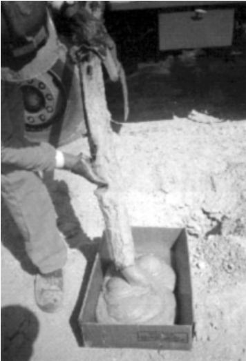
Figura 1 [6] - Emulsões explosivas.

Usualmente, os explosivos mais empregues em actividades de engenharia são à base de dinamite e reagem por detonação (figura 2).