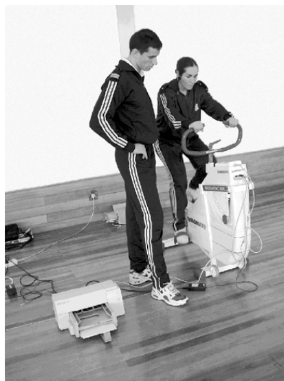
Figura 2 - Realização do teste

Nos dias de hoje, o incentivo à prática regular de actividade física pode ser uma estratégia para a promoção da saúde. Incrementos nos níveis e padrões de actividade física habitual, podem levar à redução da incidência das doenças coronárias, obesidade, osteoporose e outras, doenças que podem contribuir para a mor-bidez e mortalidade da população em geral. Actualmente está cientificamente provado que os indivíduos que aderirem a qualquer tipo de actividade física, quer por opção, quer por necessidade profissional, têm grande probabilidade de viver durante mais tempo e de uma forma mais saudável. Pesquisas mostram que uma actividade física moderada implicando um dispêndio calórico moderado têm forte impacto na longevidade (ACSM).